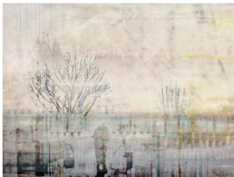
Giclée Print Motivmaße nach Absprache Auflage 20