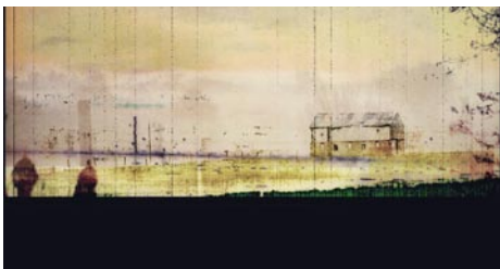
Giclée Print Motivmaße nach Absprache Auflage 20