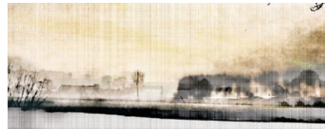
Giclée Print Motivmaße nach Absprache Auflage 20