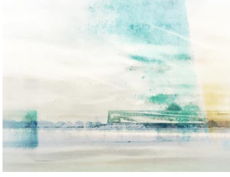
Giclée Print Motivmaße nach Absprache Auflage 20