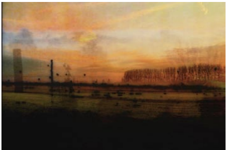
Giclée Print Motivmaße nach Absprache AUflage 20