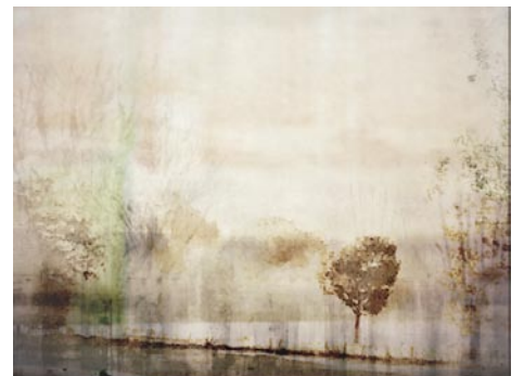
Giclée Print Motivmaße nach Absprache Auflage 20