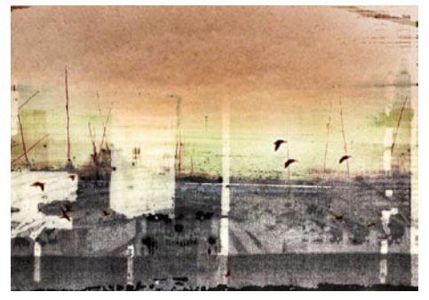
Giclée Print Motivmaße nach Absprache Auflage 20