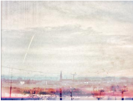
Giclée Print Motivmaße nach Absprache Auflage 20