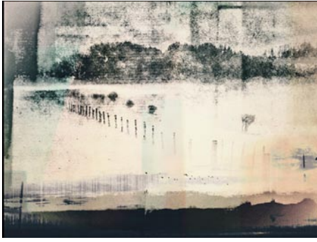
Giclée Print Motivmaße nach Absprache Auflage 20