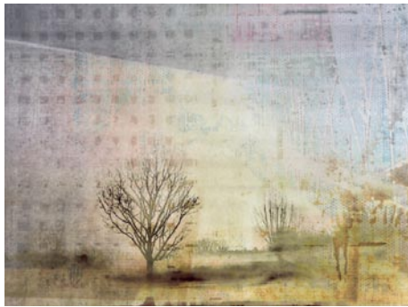
Giclée Print Motivmaße nach Absprache Auflage 20