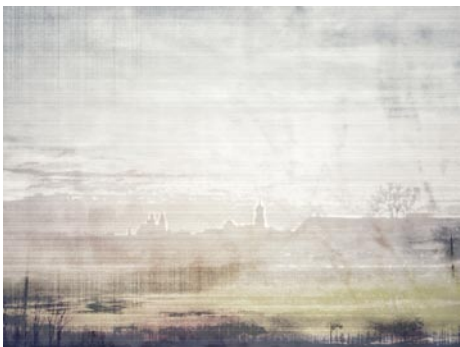
Giclée Print Motivmaße nach Absprache Auflage 20