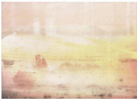
Giclée Print Motivmaße nach Absprache Auflage 20