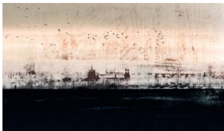
Giclée Print Motivmaße nach Absprache Auflage 20