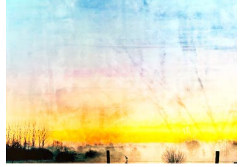
Giclée Print Motivmaße nach Absprache Auflage 20