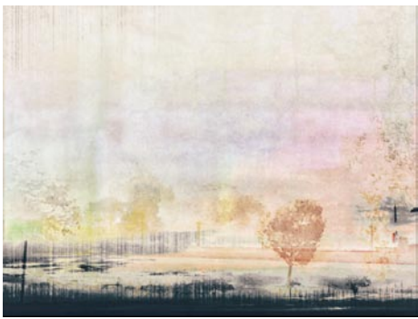
Giclée Print Motivmaße nach Absprache Auflage 20