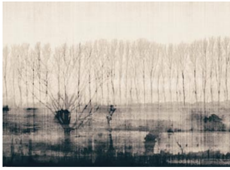
Giclée Print Motivmaße nach Absprache Auflage 20